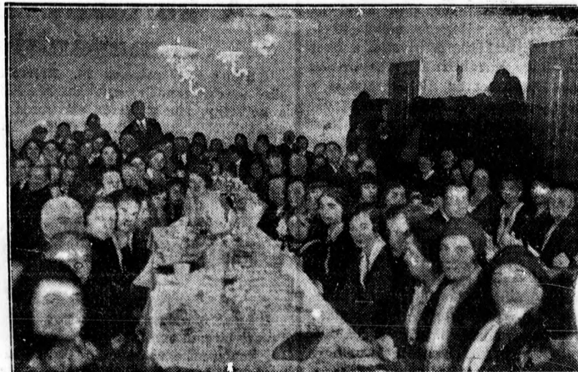
Az ipotályi egyházközség sikeres teadélutánja közönségének egyrészé.

Aki szociális bepillantást akar nyerni tavasszal a debreceni nyomorgók életébe, a legjobb alkalmat erre a zsigogón kapja, a debreceni nyomorgók nagy piacán, ahol rengeteg mindenféle tárgy kerül eladásra, többnyire olyanok, amiket már a zálogház sem fogad el. A foszladozó fehérműtől kezdve a rongyos cipőből újja fejelt topánkáig, a megrepedt cserépkorsótól Nick Carter regényéig, sparthertig és élőmacskáig, mindenféle fantasztikus dolgot adnak el a zsigogón, amelynek hatalmas területe a kuszárakta-nyával szemben minden szombaton és szerdán reggel valóban nevéhez híven