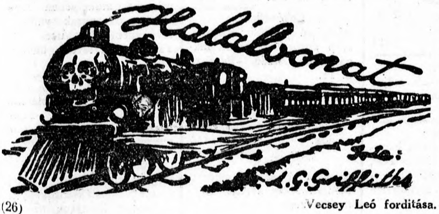
(26) Vecsey Leó fordítása.

Zsák-, ponyva-, zsinagüzet megnyitott Ferenc József 58. alatt, Fohn. 1324