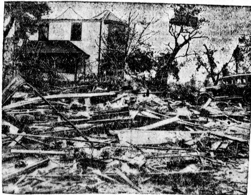
Kép az elabemai (északamerikai) tornádó borzalmas pusztításából. Házak omlottak össze és az emberek százai pusztultak el.

Váradí: Nézze apa, a többivel nem lesz semmi baj, adjon még ötvenet kölcsön. Elsején együtt — szavamra — megadom.