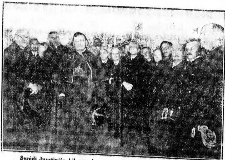
Serédi Jusztinián bíboros hercegprímás a debreceni pályaudvaron.