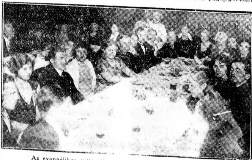
Az evangélikus Piller utca és Arany Bikában tartott báljáról.

Lindbergh ezredes egy bizonyos megjelölt helyen elhelyezett bankjegyekben ötvenezer dollárt, an-