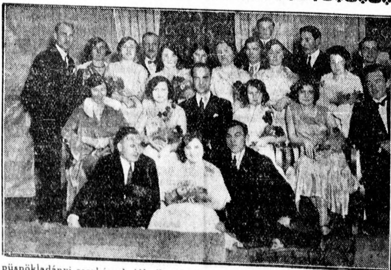
A püspökladányi cserkészek jól sikerült műsoros estely keretében előadták a „Nem lehet muzikászó nélkül” című operettet. A darab szereplői.

Igaz, hogy Magyarország helyzete csak függvénye a világ gazdasági helyzetének, de nem szabad ölbetett kézzel néz-