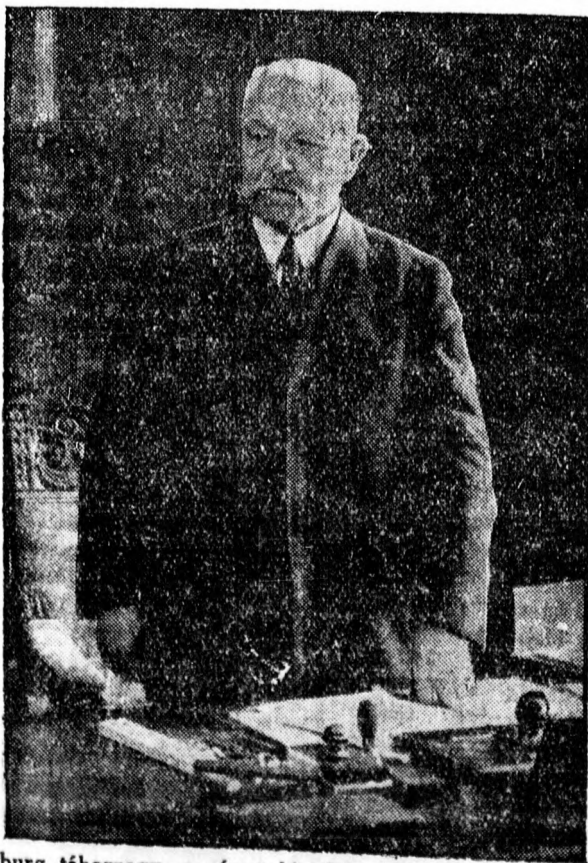
Hindenburg tábornagy, a német birodalom újra megválasztott elnöke.