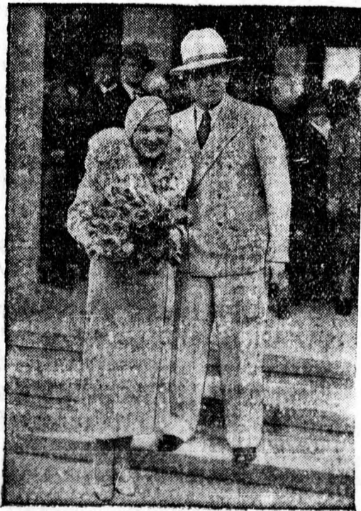
Alpár Gitta, a hírneves magyar opera- és operetténekeső, aki most Berlinben házasságot kötött a híres moziszinésszel, Fröhlich Gusztávval.

Az eljárás ezért indult meg sikkasztás címén Tóth Gergelyék ellen. A tárgyaláson azzal védekeztek, hogy a libák egy része megdőglött, az életbenmaradtakat pedig ők ették meg. A bíróság az iratok áttanulmányozása során azt állapította meg, hogy a végrehajtás szabálytalanul történt és ezért büncselekmény hiányában Tóth Gergelyt és feleségét felmentette a vádalól.