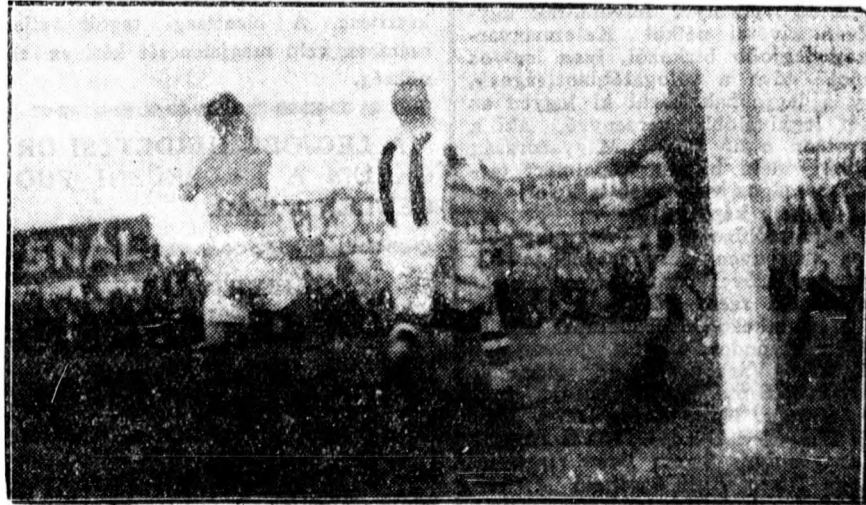
Bocskay-ostrom a Ferencváros kapuja előtt.

De a Bocskay harci kedve még mindig nem lohadt le. Néhány remek támadás szárnyal a ferencvárosi kapu