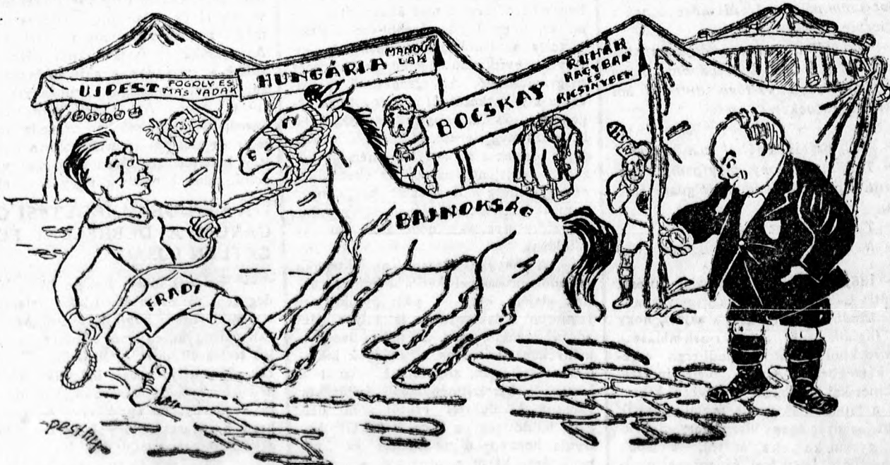
FERENCVÁROS: Alig bírom hazavinni ezt a csökönyös jószágot... BÍRÓ: Várjon csak, majd én biztatom egy kicsikét...

A fiatalok versenyei mindig szívét gyönyörködtető látványok voltak a tel- nőttek számára, ez a verseny azonban külön érdeklődésre tarthat számot, mert a legmagyarabb sportban, a kardvívás-