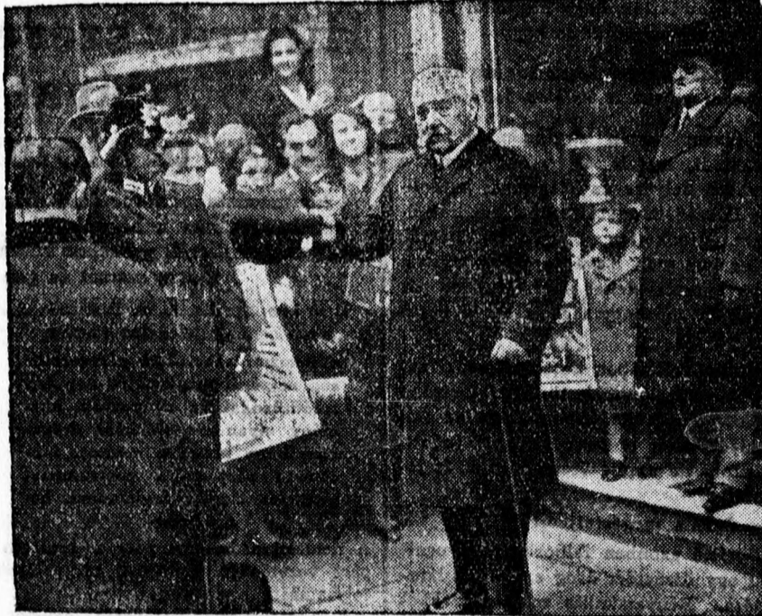
Hindenburg elnök állampolgári kötelességének teljesítése után távozik a szavazási helyiségből.

A magyar kereskedelem európai viszonylatban is megfélelt hivatásának, teljesítette hivatását és a magyar kereskedő leleményessége, rátermettsége, megbízhatósága sok dicsőséget és elismerést szerzett a magyar gazdálkodásnak. Ha a magyar kereskedelem nem kap segítyét még a for-