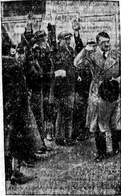
Hitler Adolf a müncheni választási helyiségben.