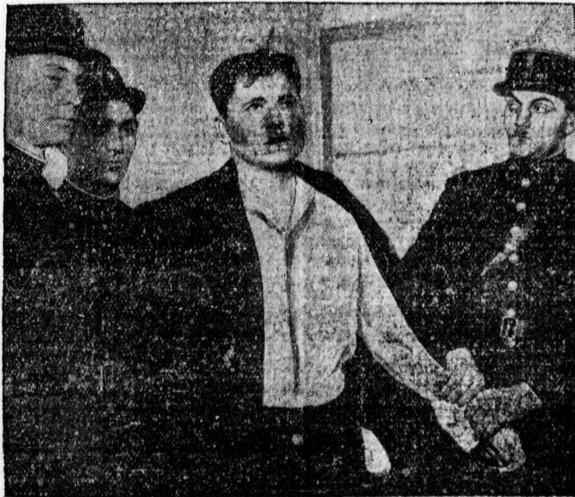
Szokratavírón közvetített kép Gorguloff orosz emigráns, Doumer elnök gyilkosának elfogatásáról. A rendőrök körülfogják a merénylőt, akinek ruháját összetépte és arcát véresre verte a tömeg, amely lincs-ítélettel akarta megboszulni a gyilkosságot.

A választások eredménye után nem képzelhető más, minthogy a baloldali