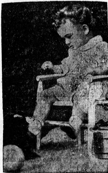
A gyermekrablás előtti napon készült ez a felvétel Lindbergh tragikus sorsa fiacskájáról.

A rablók üldözését egyébként most már maga Lindbergh irányítja, aki