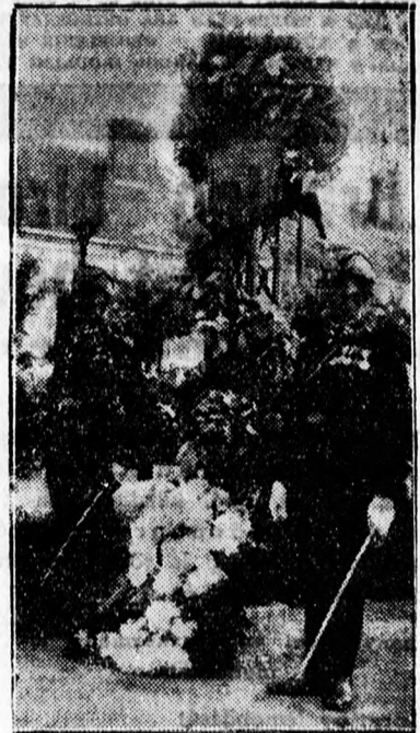
A HŐSÖK EMLÉKÜNNEPE.

A magas szárnyalású beszéd után az emlékfásorok megkoszorúzása következett. Debrecen város nevében dr. Csü-