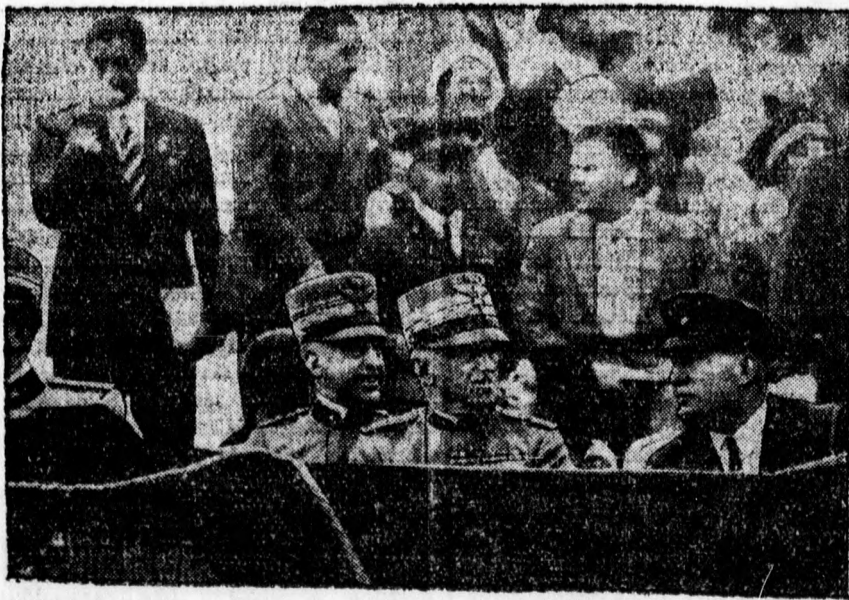
Az olasz király és Mussolini a római repülőnnepen a diszpályóban.

A kormány a földmivvelésügyi tárca keretén belül és kívül is gondoskodni kíván a mezőgazdaságról. Az értékesítés-