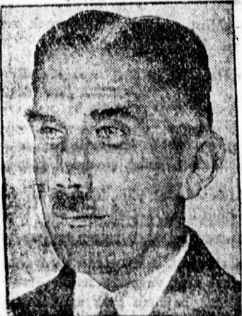
VON PAPEN FERENC, az új német birodalmi kancellár.

A LEGJOBB HIRDETÉSI OR- GANUM A DEBRECENI FÜGGETLEN ÚJSÁG.