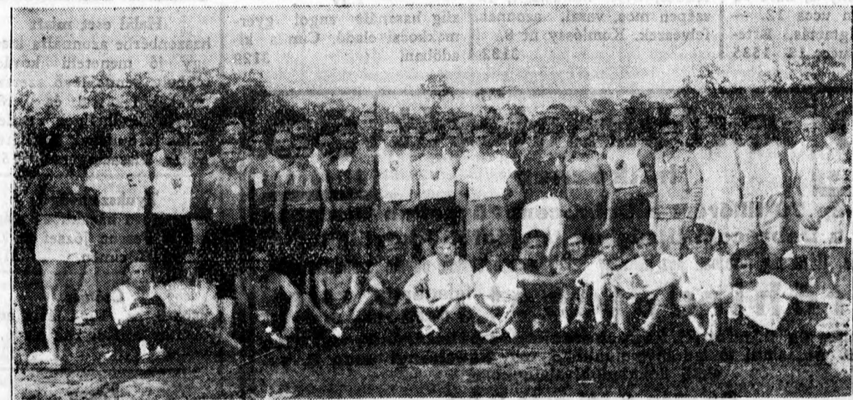
A főiskolai atletikai verseny résztvevői.

Ruhacsere. Használt férfiruháért prima szövözetet adok. Végh szabó, Burgondia ucca 2. 1489