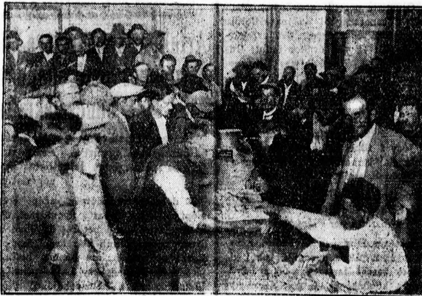
Osztják a munkanélküliek segélyét.

A tömeg csöndben, nyugodtan hallgatta a párttitkár szavait, amelyek