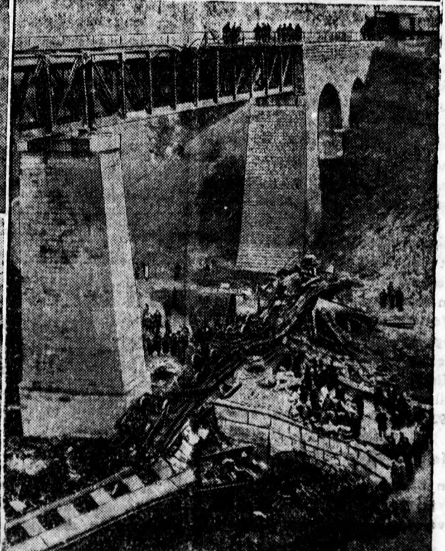
Matuska Szilveszter, az elvetemedett vasúti merénylő és rémtettei. Fenn balra: A jüterbogi vasúti katasztrófa. Fenn jobbra: Matuska Szilveszter. Lent balra: Matuska első kihallgatása. Lent jobbra: a biatorbágyi merénylet, a viaduktról lezuhant és ízekre tört vasúti kocsi.