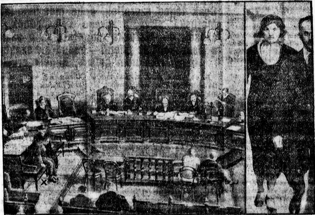
Rádióon továbbított kép a Matuska nevűről. Baloldalon a vádlott X-el jelölve. Jobboldalon: Matuska felesége.

— LEGJOBB HIRDETÉSI ORGANUM A DEBRECENI FÜGGETLEN UJSÁG.