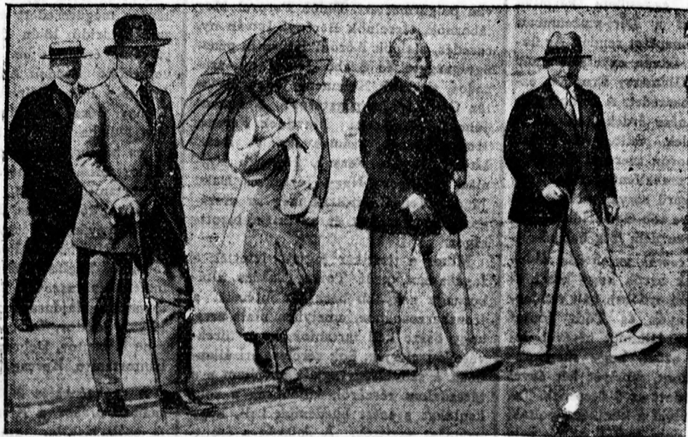
II. Vilmos, a volt német császár Zandvoort tengeri fürdőn feleségével.