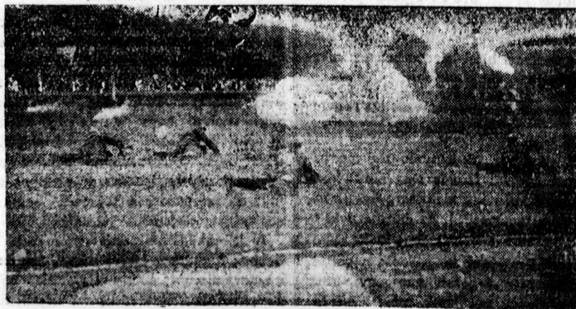
Harcserű gyakorlatok (előnyomulás tüzérségi tűzben) a Bocskay hajduered vasárnapi sportünnepén.

önhatalmulag bitorolja az elnöki széket, hazaáruló volt, el akarta