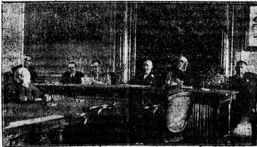
Az izraelita tanítók debreceni kongresszusáról: az elnökség.