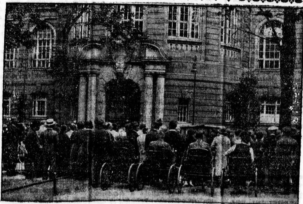
Hadirokkantak tüntetnek a német birodalmi munkaügyi minisztérium előtt Berlinben rokkantsági járulékok csökkentése miatt. A rokkantak be is hatolcsak hosszú rábeszélés után hagytak el. tal a minisztérium épületébe, amelyet