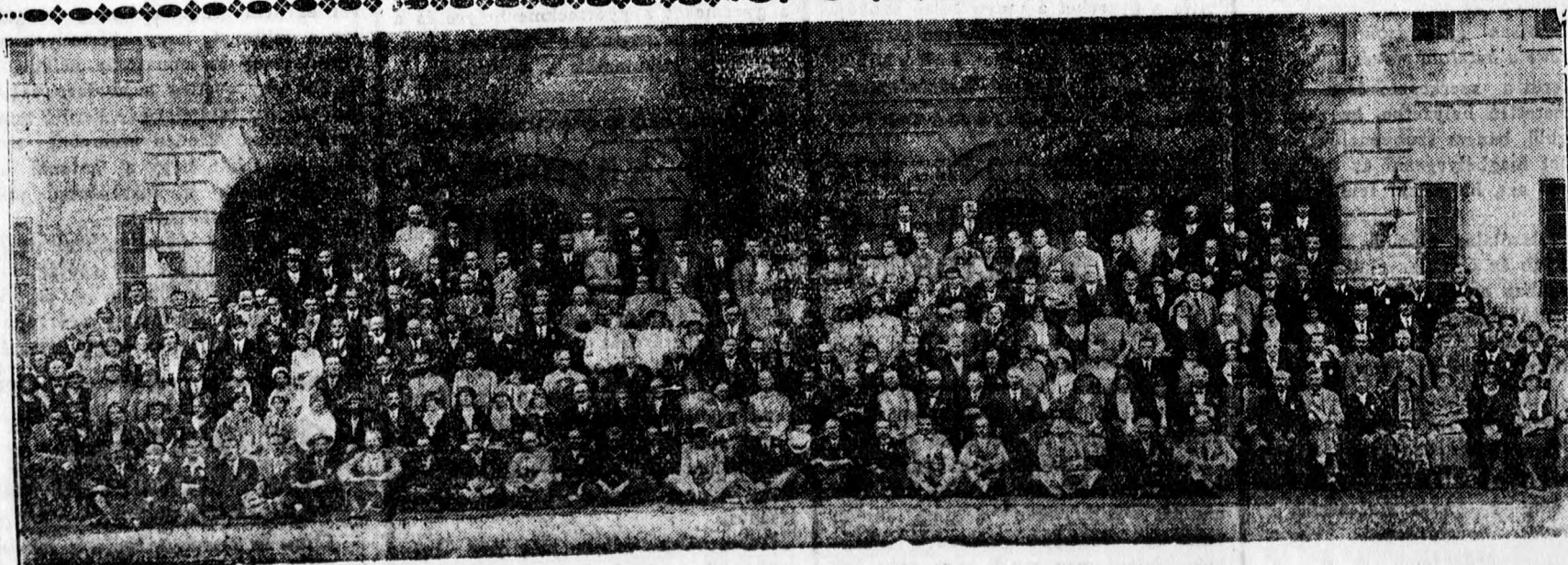
A ref. tanítók országos kongresszusának résztvevői a Kollégium udvarán.