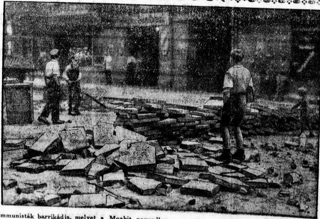
Berlini kommunisták barrikádjá, melyet a Moabit negyedben a rendőrszolgák felvonulásának megakadályozására emeltek.

A gyermek a hirtelen eséstől megszeppenve, keserves sírásra fakadt. Az ügyvédek és a teremszolga utánarohantak az elkeseredett asszonynak, hogy