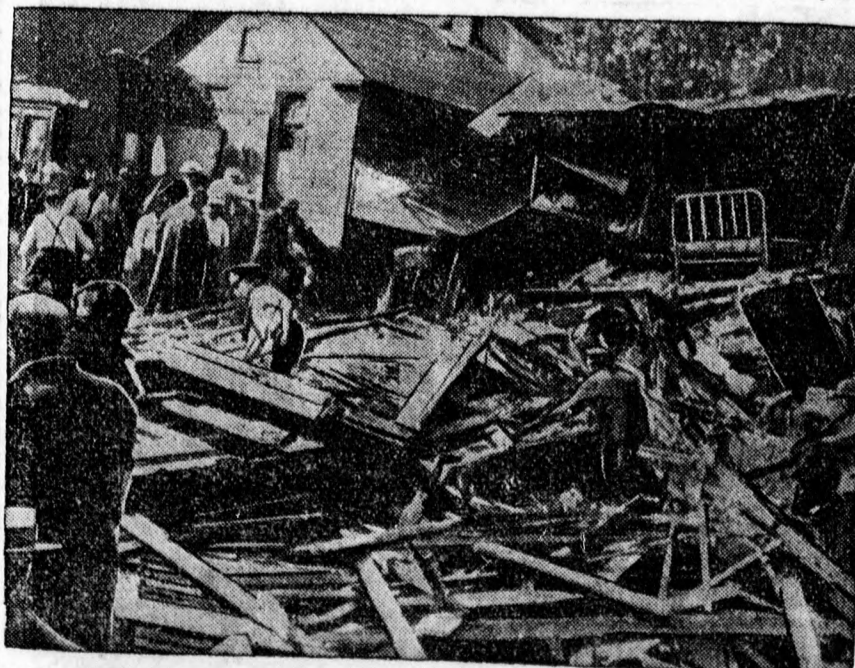
Földrengéshez hasonló autókatasztrófa történt egy amerikai farmer-faluban. Két óriási gyorsasággal rohanó autó ütközött össze az úton s az összeütközés ereje mindkettőt a faházak közé vetette, amelyekben hallatlan rombolást okoztak.

A 33-as bizottság ellenzéki tagjai általában kétséges értékűnek tartják a moratórium bevezetését, mert az a felfogás, hogy a moratórium nem fog október 31-én megállni, hanem tovább lesz kénytelen a kormány azt kiterjeszteni. Hangsúlyozták azt is, hogy a gazdamoratórium azért is veszedelmes, mert