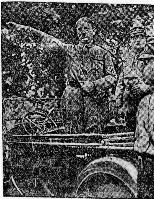
Hitler Adolf a müncheni bevonuláson, amelyen 12.000 „náci” vett részt, ki-nyújtott kézzel üdvözlö a rohamszervezetek felvonuló osztagait.