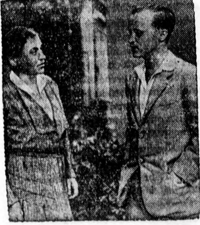
Manuel portugál király halála után most Dom Duarte braganzai herceg a portugál trón követelője. Képünkön az új portugál trónkövetelő anyjával, született Loewenstein-Wertheim Terézia hercegnővel beszélget.