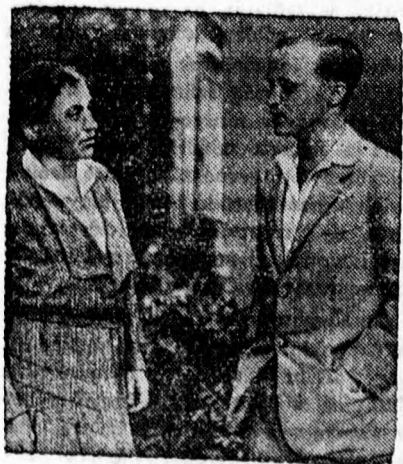
Manuel portugál király halála után most Dom Duarte braganzi herceg a portugál trón követelője. Képünkön az új portugál trónkövetelő anyjával, született Loewenstein-Wertheim Terézia hercegnővel beszélget.

Csak az alkotónak szabad olyan elfogultnak lenni, mint amennyi elfogultságot Herriot szavai árulnak el. Nincs különbség győző és legyőzött között? Nézzék meg Európa mai térképét, hasonlítsák össze azzal a térképpel, amiről az iskolában tanultak s meg fogják látni, hogy van-e különbség? Amíg megcsontított területű és megcsontított életfeltételű államok szenvednek Európa közepén, addig nem szabad azt mondani, hogy nincsenek különbségek. A lausannei megállapodásban mi csak bizonyosságát látjuk a versaillesi koncepció esztelenységének és végrehajthatatlanságának. S minden legyőzött államnak az a kötelessége, hogy ezt a bizonyosságot a világ nyilvánossága előtt feltárja. Ha nincsenek győző államok, akkor ne legyenek jogai sem a győzelmeknek. Ha megszűnt a jogaim, akkor meg kell szűnni a birtoklásnak is. Nem elég azt mondani, hogy nincs győző és nincs legyőzött, de meg is kell szüntetni a győző és legyőzött, közötti különbséget. Magyarország kétharmadrészt miért tartják birtokukban a „győzők” ha nincs már győzelem és nincsenek már győzők. Vissza 1914-be! ez lehet Lausanne után a világpolitika programja. A világháborút csak egyféleképpen lehet likvidálni, ha minden emléket, hatását és jogcímét eltöröljük. Nem elég az, hogy a legyőzöttektől tovább nem követelnek jóvátételt, adjanak végre jóvátételt a győzők. S ne is a legyőzötteknek adjanak, hanem az emberiség nyugalmanak, békéjének és biztonságának.