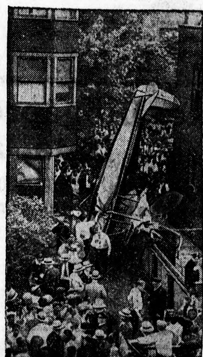
Egy amerikai repülőgépet Chevelandban különös módon ért szerencsétlenség: motorhiba miatt kényszerleszállást kellett végrehajtania a pilótának. Gépe két ház közé esett, a propeller a talajba furódott. A különös földrezzállásnál a háznak csak egyetlen lakója: egy nő, sebesült meg.

Bata Magyarországon is le akart telepedni. Már meg is alakult a magyarországi Bata R. T. Szó volt arról is, hogy Debrecenben állítja fel magyarországi gyártelepét. A világhírű óriási gyárat most a régi igazgatósággal a fia vezeti tovább.