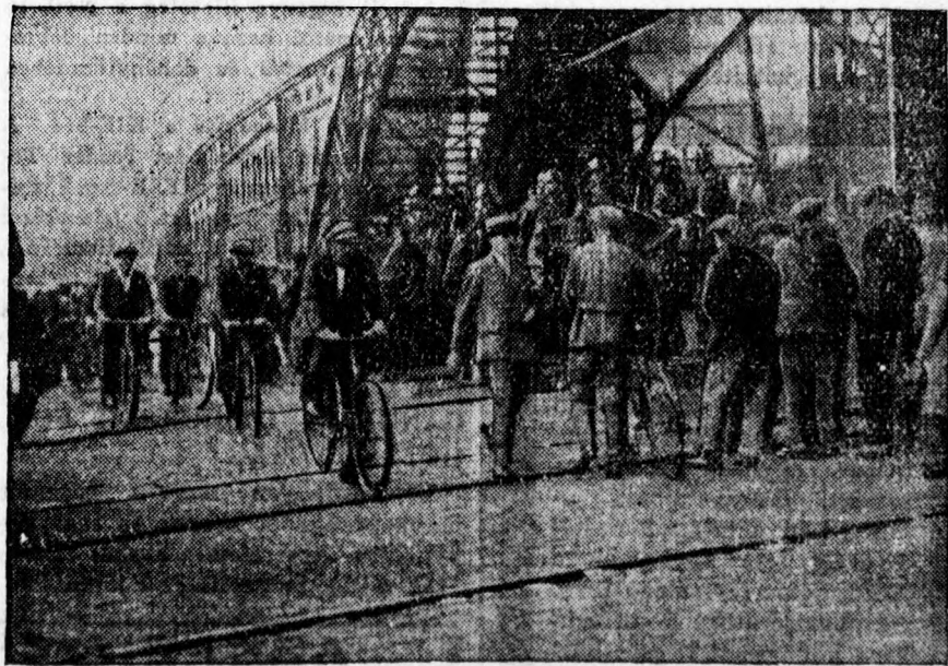
A belgiumi komoly munkászavargásokról. Lovasrendőrség vigyáz a rendre Charleroi vámkapujánál. Több, mint 70,000 munkás sztrájkol Belgiumban, a legkomolyabb összetűzések a katonaság és munkásság között Charleroinál történtek több halálesettel.