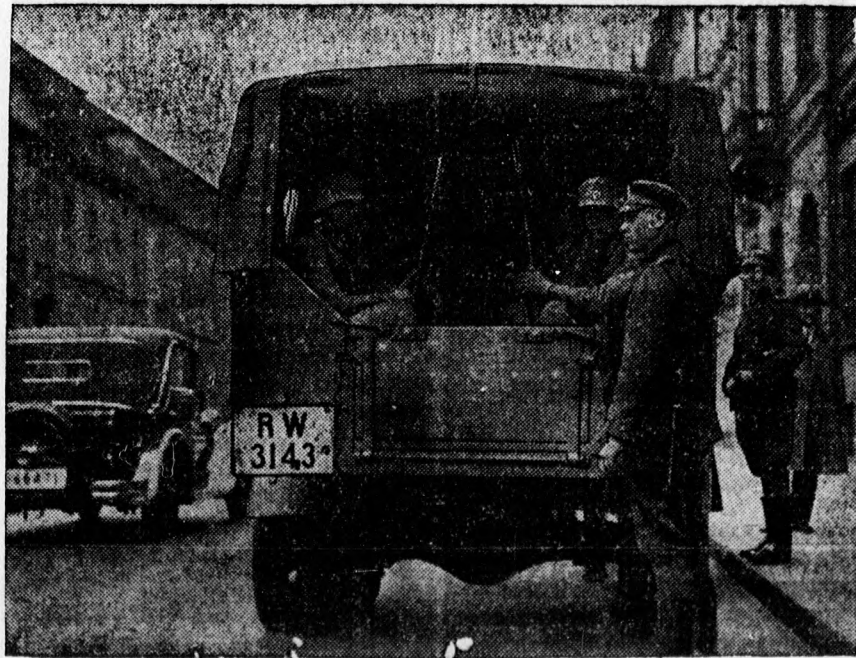
Pillanatkép a Wilhelmstrassen a porosz állami minisztérium előtt, amelyet fegyveres katonaság szállott meg és tart őrizetben.