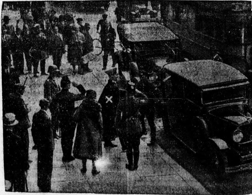
Heimannsberg rendőrezredest, a rendőrlégénység volt parancsnokát (X) a Reichswehr katonák a katonai fogházba viszik.

A LEGJOBB HIRDETÉSI ORGANUM A DEBRECENI FÜGGETLEN UJSÁG.