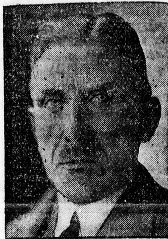
Papen birodalmi kancellár, a porosz birodalmi biztos.

a stuttgarti konferencia, amelyre Papen birodalmi kancellár az egyes országok képviselőit összehívta. Egyenesen azért hívták a külön-