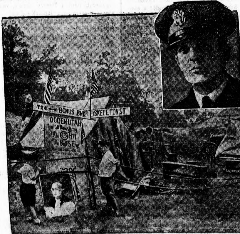
Az amerikai veteránok Washington környékén sátertáborokba telepedtek, ahol gyermekeik is velük laknak. A sátertábor tankkal és lovassággal támadta meg a katonaság legutóbb és az akciót MacArthur amerikai vezérkari főnök vezette. (Képe a jobbsarokban.) Több, mint száz veterán rebesült meg súlyosan.

A bejelentés sokkal nagyobb meglepetést keltett, mint bármilyen ítélet. Voltak, akik halálos ítéletet vártak,