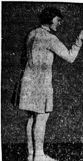
Ellen Preis kisasszony, a törvívó világbajnoknő, aki Los Angelesben Bogen Ernát legyőzte.

zília kitiltása annyit jelent, hogy Magyarországnak eggyel kevesebb pólómérkőzést kell játszania a bajnoksáért, másrészt pedig azt mondják: