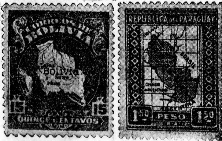
Bélyegek, amelyeket a háború hozott életre. Bolivia és Paraguay bocsátották ki ezeket a bélyegeket, amelyek mindegyike térkép segítségével hirdeti az államok nemzeti aspirációit.

A vasárnap Debrecenben kezdődő kereskedői kongresszus vendégeinek elhelyezése érdekében a nagyközönséghez fordulunk. Akkor, amikor a néhány száz tagot kitevő vendégsereg két napi tartózkodásra az ország minden részéből ideérkezik, igen fontos, hogy minden egyes vendég a legkellemből impressziókkal távozzék körünkből. Nincs kétségünk az iránt, hogy nemcsak a kongresszus életbevágó anyaga, hanem Debrecen városa maga is sok, új látóvilágával kellemes emlékeket fog vendégeinkben hagyni. Minden debreceni polgárnak át kell éreznie, hogy közgazdasági, idegenforgalmi stb. szempontokból milyen fontos, hogy minden egyes vendég megfelelő szálláshoz jusson. Éppen ezért tisztelettel felkérjük Debrecen város közönségét, hogy a vendégek részére üresen álló,