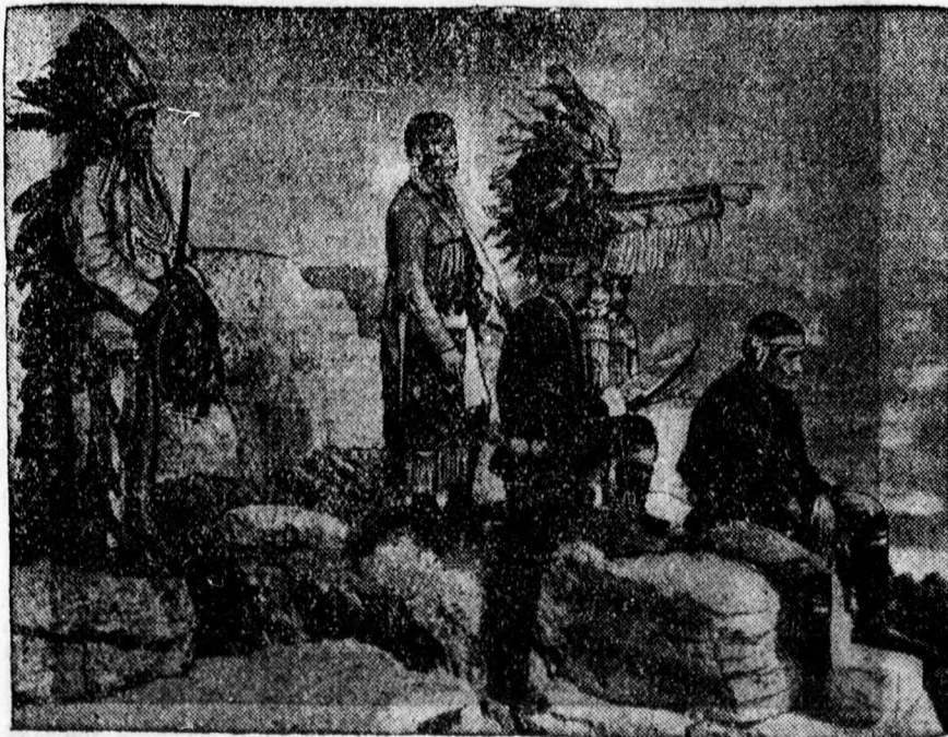
Manitou utolsó fia. Festői fölvetél az USA utolsó indiánjai egy csoportjáról, akik a kiutalt területen még régi szokásaik és erkölcsük szerint élnek.

Már csak idegenforgalmi szempontból is kívánatos volna, hogy az Országos Tűzoltó Szövetséget Debrecen város is meghívja közgyűlés tartására s remélhetőleg erre rövidesen sor is fog kerülni.