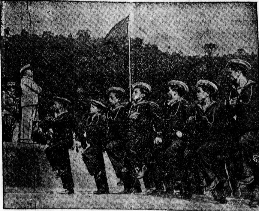
Az olasz tengerészcadetok tisztelgő díszmenete Mussolini előtt.