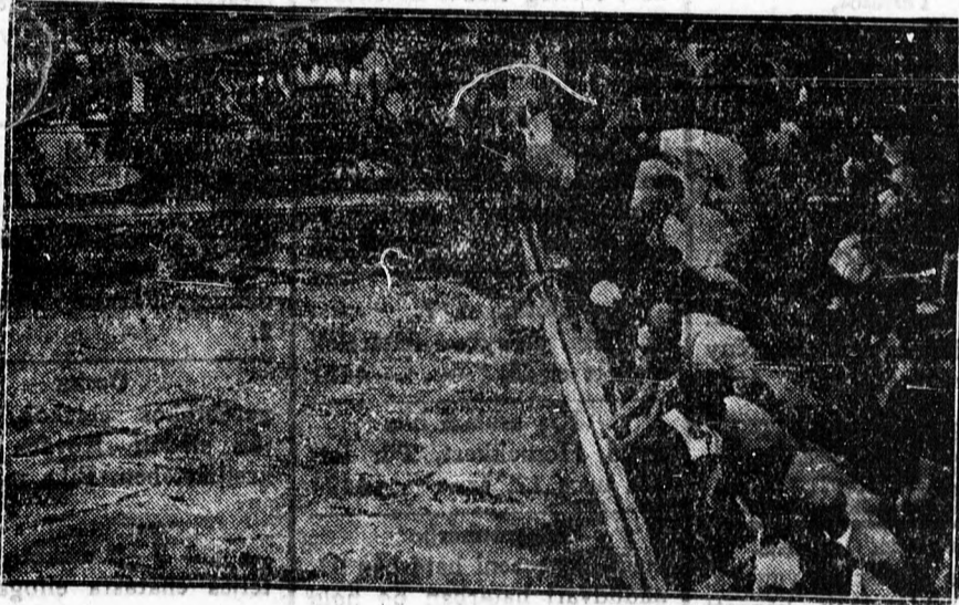
A kerületi bajnoki uszóverseny a városi uszodában. Start előtti izgalom.