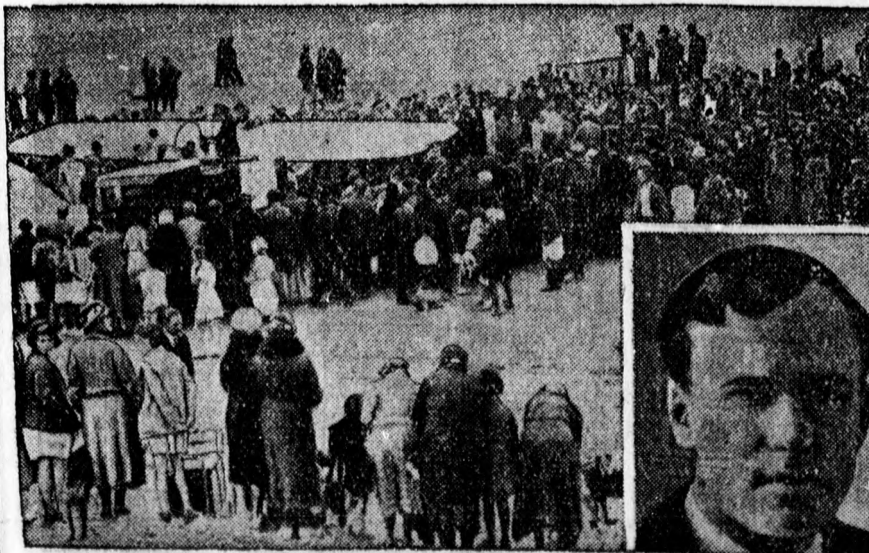
Mollisonnak, a híres oceanrepülőnek elindulása Irországból az Atlanti ocean Európából való átrepülésére, amely először szőlőgépen Mollisonnak sikerült. Mollison azonnal visszafelé akart indulni Amerikából, ez azonban nem sikerült és így csak egy hét múlva indul ismét vissza, hogy hazahozza gépét.

Ezért mérte ki számunkra a történelmi igazság a „magyar vallás”, „magyar egyház” nevet.