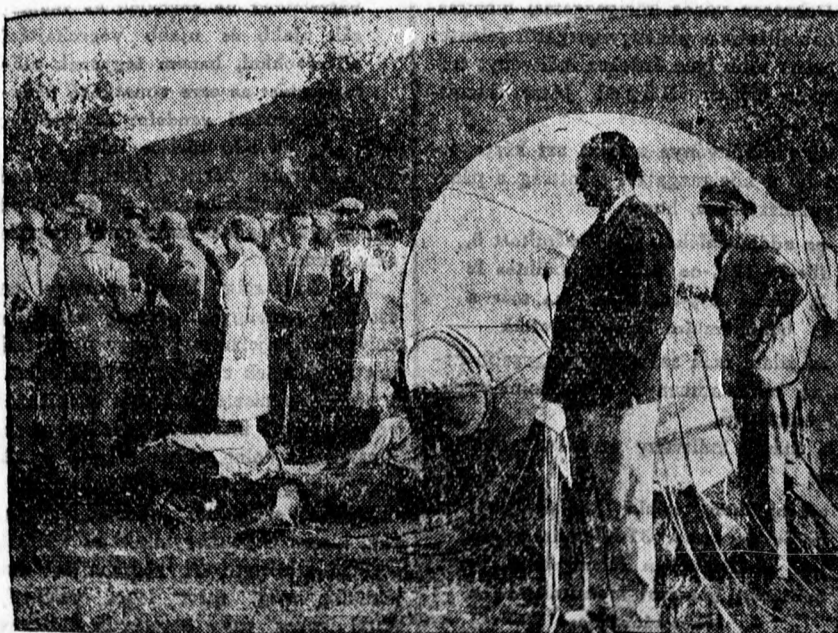
Az egyetlen fénykép Piccard tanár földreszállásáról a sztratoszféra repülés után Felső-Itáliában egy gyümölcsös kertben. Piccard tanár ma megérkezett Svájcba, ahová utánaszállítják ballonját. Rekordja azonban, úgy látszik, nem sokáig fog tartani, mert Londonból érkezett hírek szerint Oswald Short angol turós óriási ballonnal és könnyű alumínium gondolával 27 kilométeres magasságot akar elérni. Stockholmi jelentések szerint viszont Piccard mégis megfelelő jutalmat kap hősiességéért, amennyiben az idei Nobel-díjra őt fogják előterjeszteni.

pedig helybeli keletkezésű bűnügy volt. Történt 181 lopás, 7 öngyilkossági kísérlet, amelyből 4 halállal végződött. Lázadás, illetve társadalmi rendelleni izgatás történt 3, rablás 4, sikasztás 60 esetben. A rendőri büntető bírósághoz beérkezett 317 feljelentés.