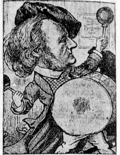
Most 50 éve Wagner Richard hatal- mas zeneműve, a Parsifal bemutatója- nak. Annak idején így karrikírozták Wagnert, akinek nagy zenekarával, markáns hangszerelésével nehezen bé- külték meg a konzervatív zenebarátok.