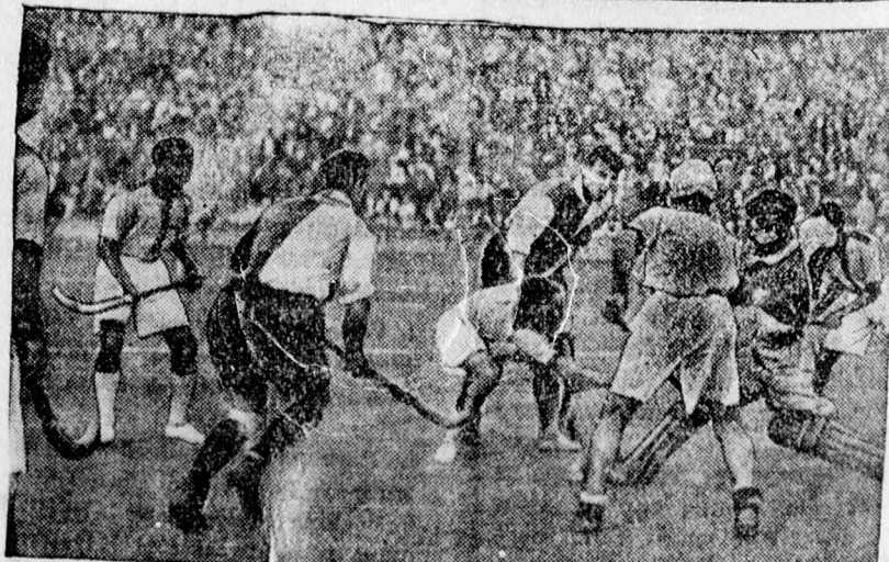
A világhírű indiai gyepholki csapat küzdelme a budapestiakkal, akiket 5:0-ra győzték le az indusok.

a most megjelent és állítólagos adókedvezményeket nyújtani szándékozó rendelet is oly lehetetlen feltételekhez köti az adókedvezmé-