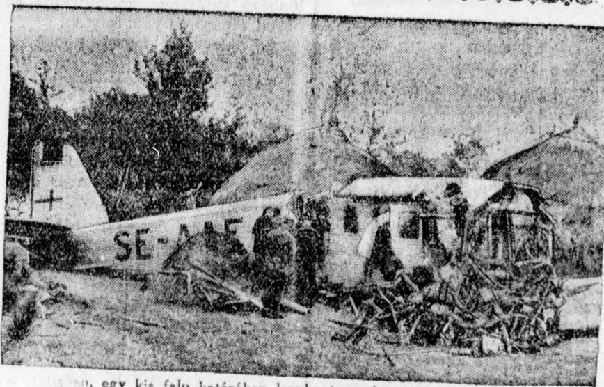
Szeptemberben, egy kis falu határában lezuhant az Amsterdam-Malmö repülővonalán egy postagép. A vezető és a mechanikus meghaltak.

— Az eddigi jelek szerint a közönség melegen támogatja intézményünket az idén is. Új tagok is szép számmal jelentkeznek, úgy hogy a legszebb reményekkel indulunk az új szezonnak.