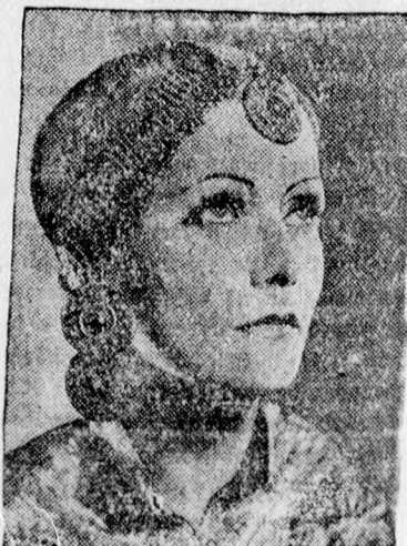
Greta Garbo, legújabb nagy szerepében, amelyben Mata Huri, a híres kémtáncosnő szerepét játszotta.

A földmivelésügyi miniszter most leiratot küldött Debrecen városhoz és Hajdúvármegyéhez. A leiratban közli, hogy a vetőmagkölcsönből eddig kétféle millió hatszáz ezer pengőt nem fizettek vissza a gazdák. Az állam pedig nincs abban a helyzetben, hogy hitelezhessen, ezért tehát azoknak a gazdáknak, akiknek még hátralékuk áll fenn a vetőmagkölcsönből, amely szeptember 30-án lejár, tartozásukat okvetlenül meg kell fizetniük. A 2,600,000 pengős tartozás természetesen nemcsak a két megnevezett törvényhatóságot, hanem az egész ország gazdaközönségét terheli. A mai rossz viszonyok között, amikor a terméseredmények katasztrofális helyzetbe sodorták a tisztántul gazdákat, alig képzelhető el, hogy fizetni tudjanak.