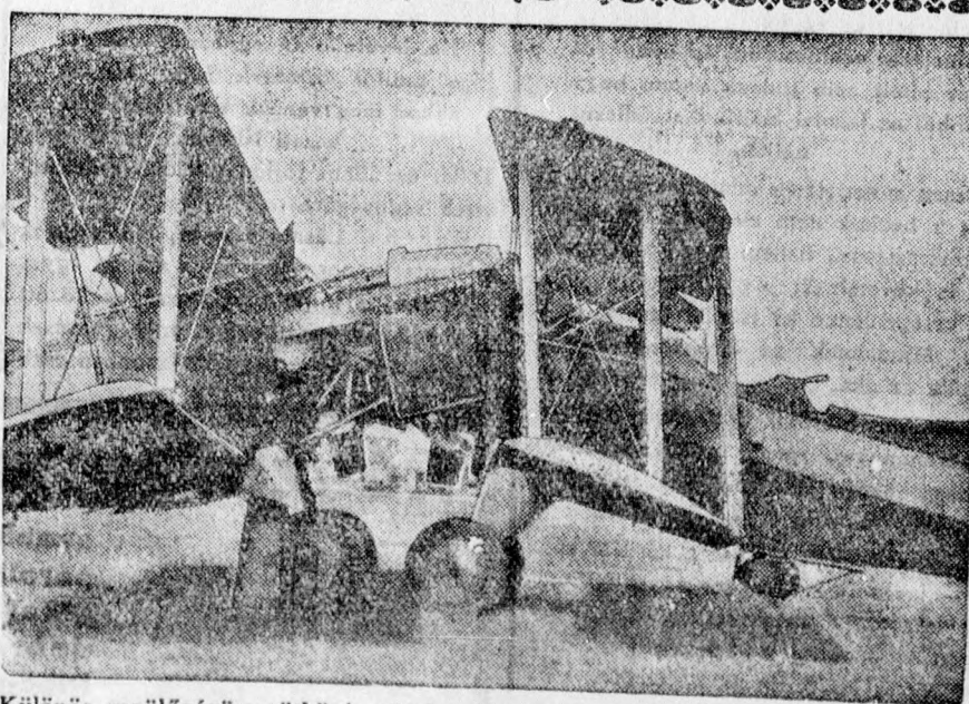
Különös repülőgéppösszeütközés történt Newyorkban a földön, ahol egy felszállani készülő gép egy leszálló géppel ütközött össze, úgy hogy a két gép motorja egymásba rontott.