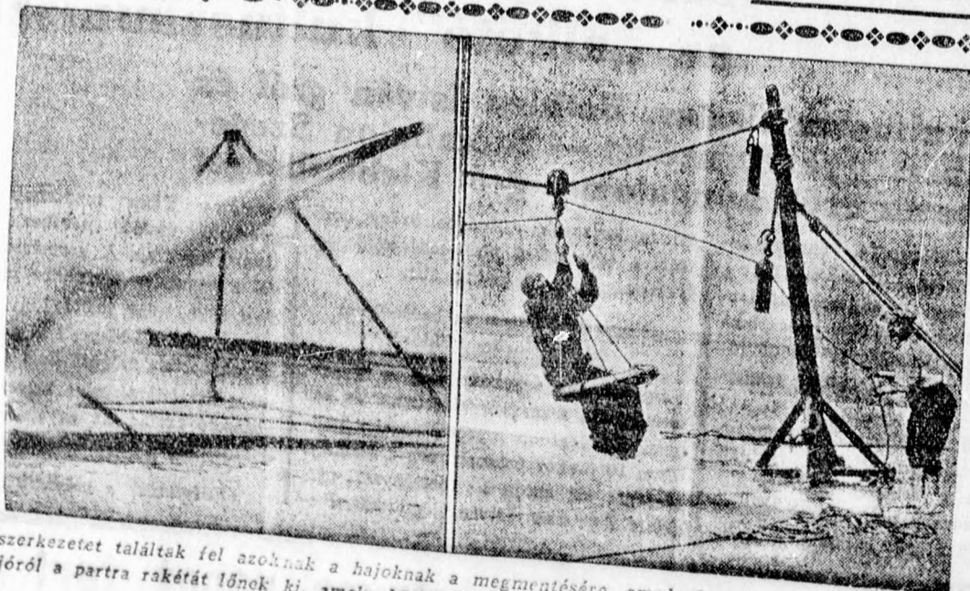
Új mentőszerkezetet találtak fel azoknak a hajóknak a megmentésére, amelyek a part közelében zátonyra futottak. A hajóról a partra rakétát lőnek ki, amely kötelet von maga után és ezen a kötelen át mentik meg a süllyedő hajó utasait.

automatikus gyorsmérlegek eladására, akik henteseknél, mészárosoknál, fűszer és csemegekereskedőknél jól be vannak vezetve. Leveleket „jó kereseti lehetőség” jellegével Leopold Cornél hirdetőiroda, Budapest V. Teréz körút 3. szám, továbbít.