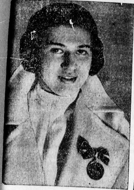
Ellen Preisz, az olimpiai törvívás győztese, az arany érdemrendet kapta meg az osztrák kormánytól.