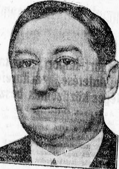
GRÓF KLEBELSBERG KUNÓ, az elhunyt kultuszminiszter, akinek temetése szombaton folyt le nagy fényvel és országos részvét mellett Szegeden.

Az egyetem és a tudományos társaságok bucsuztatói után a fogadalmi templom kriptájában helyezték el Klebelsberg gróft.