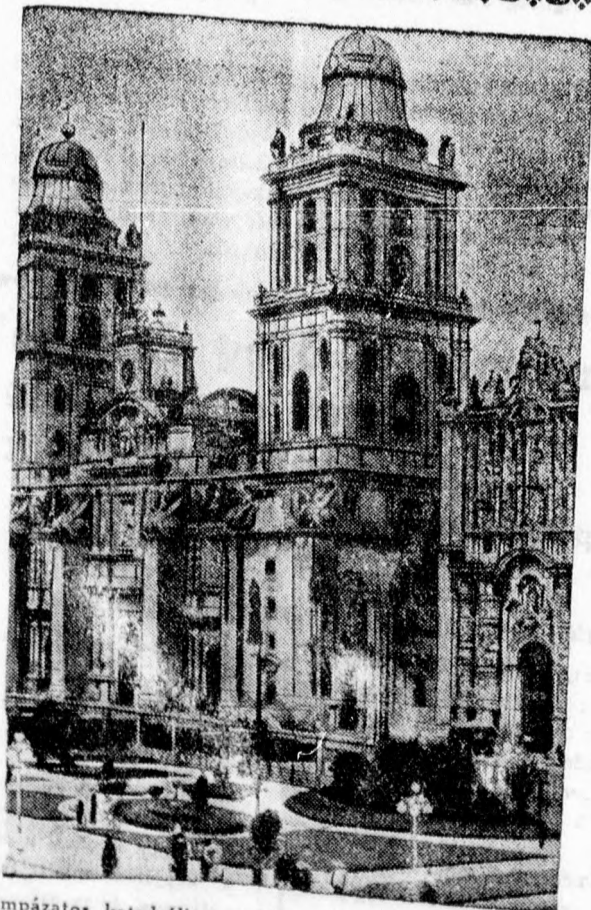
Mexico-City pompázatos katedrálisa, amelyet állami tulajdonba vettek az egyházi vagyonok elkobzása folytán. A pápai nuncius a kormányzatra emelt a rendelkezése folytán hagyta el Mexikót.

A mérkőzés elé éppen az előzetes izgalmak következtében felfokozott