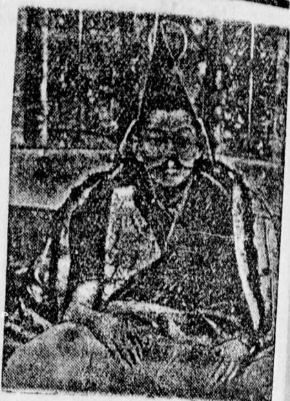
A Dalai Lára, akinek Tibetből men- külnie kellett népének egy felkelése elől. A felkelés a Dalai Lára, a meg- testesült Budha gazdasági politikája miatt tört ki és eredményezett heves harcokat.

A LEGJOBB HIRDETÉSI OR- GANUM A DEBRECENI FÜGG- ETLEN UJSÁG.