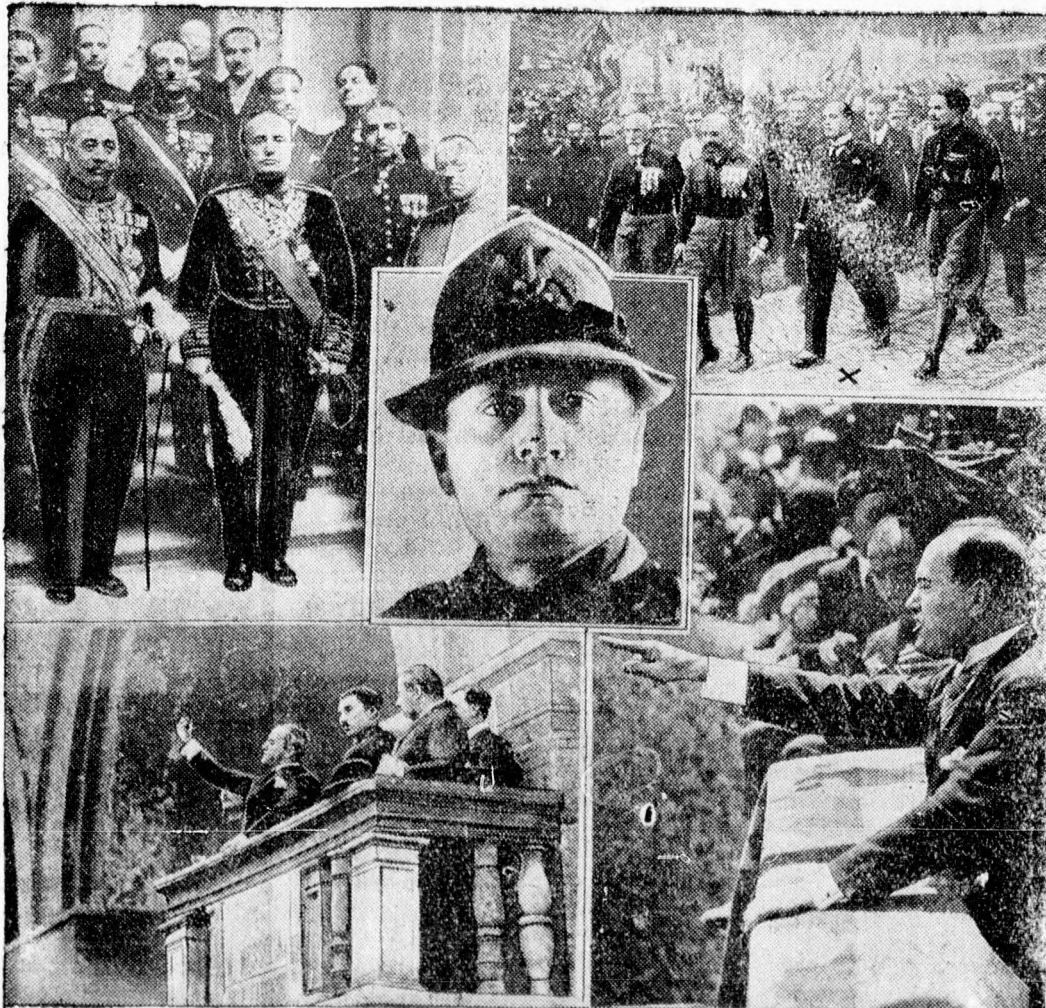
A FASCIZMUS TIZEVES.

a HEGEDÜS és SANDOR rt. Piac ucca 34. sz. üzleti helyisége teljes üzleti felszereléssel vagy anélkül