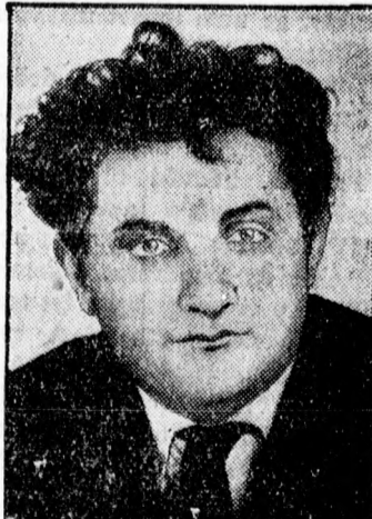
Kamenew, Szovjetország volt római követe. Trotzky sógora és Si- nonyew, a végrehajtó bizottság volt elnöke, akiket most Stalin nyomására kizártak a pártból, mivel a pártvezető ellen izgáltak és a szovjethata- lom mostani urainak eltávolítását követelték.