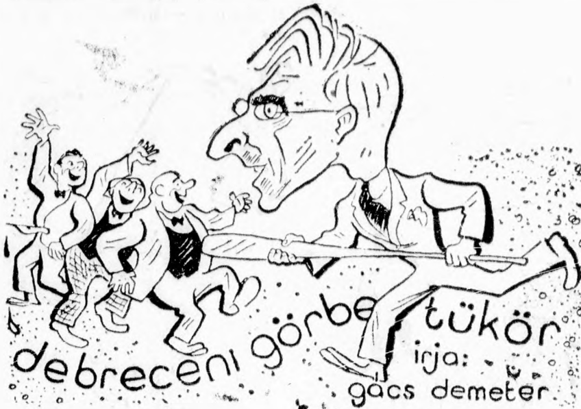
(Az „Igy irtok ti” dallamára)

Építő Takarékszövetkezet kerületi igazgatósága Debrecen, Piac u. 58. Telefon 27—83.