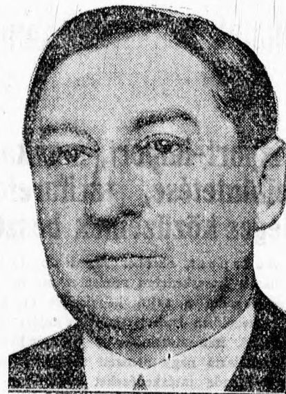
GRÓF KLEBELSBERG KUNÓ, az elhunyt kultuszminiszter, akinek temetése szombaton folyt le nagy fényvel és országos részvét mellett Szegeden.