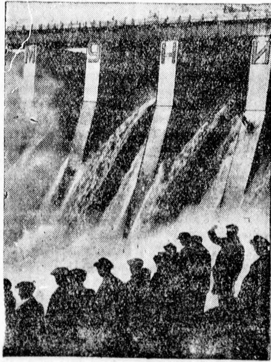
Oroszország Európa legnagyobb vízierőművének munkája befejezését ünnepli. Kiltás a 750 méter hosszú óriási vizesére Dnjeprostoi mellett, amely egy hatalmas elektromos művel összel 720.000 lóerő energiát szállít.