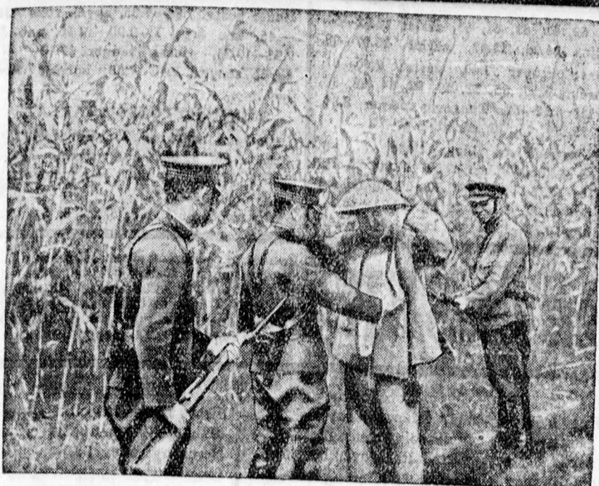
Japán védekezése a kínai banditák ellen: japán katonák kutatják át az embernél magasabb sorghum-fü hozót, amely a kínai rablóbandák szokott tanyája és minden elfogó tat alaposan átkutatnak.