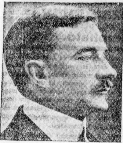
MANIU GYULA, az új román, miniszterelnök.

nak címezzék, amikor ő kegyelmes asszony.