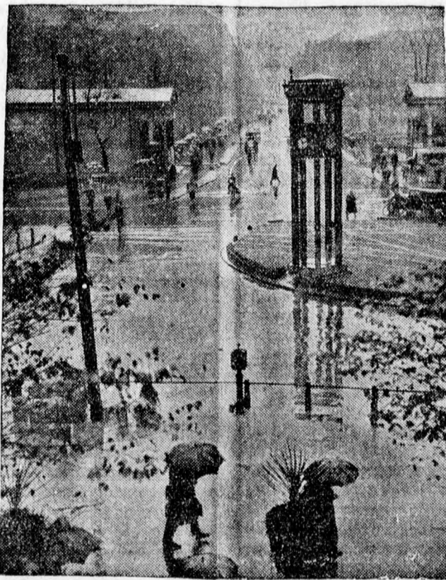
Berlin uccán meglélt a járműorg. A terti kepen látható Berlin legforgalmasabb utvonala a Potsdamer Platz, amely a közlekedési sztrájk óta egy csöndes, kihalt kis vidéki város uccájára hasonlít, a széles kocsiuton alig tűnik fel egy-egy jármű, holott néhány nappal ezelőtt még a villamosok, autók és autóbuszok ezrei robtak rajta végig.