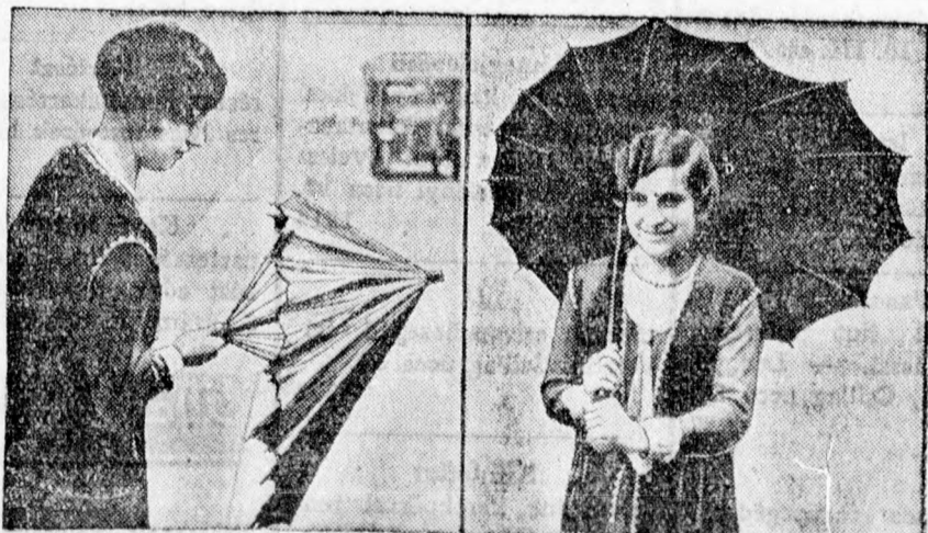
Esernyőtalálmány. Londonban mutatták be ezt a modellt, amely az eddig volt kerek forma helyett ésszerűbben oldja meg a test eső ellen való megvédését. Az ernyő az ellenkező oldalt mint amelyiken tartják és a hátat is megvédi az eső ellen.