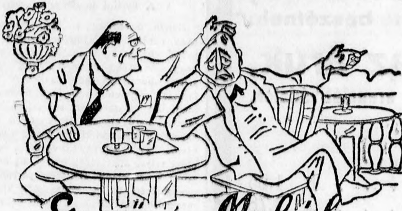
Gerő és Melák Írta: Ordas

módszerénél. Magától értetődő, hogy csak csoportos tanításnál és kezdő fokon levőknél alkalmazható.