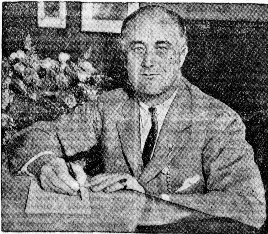
Roosevelt, a demokrata elnökjelölt, aki a kedden megtartott választás első hírei szerint nemcsak igen veszélyes ellenfele Hoover elnöknek, hanem valószínű győztes is a választáson.

A kereskedelemügyi miniszter most rendeletet küldött le Hajdúvármegye és Debrecen város törvényhatóságához. E rendeletben közli, hogy december 4. és 18. napjaira eső vasárnapon az üz- letek 7 órától 2 óráig tarthatók nyitva. A pálinkamérések zárvatartására vo- natkozó intézkedések azonban e napo- kon is érvényben maradnak és azokat ezeken a napokon is zárva kell tartani. A huszeműek árusítása Budapest és Debrecen területén ezeken a vasárnapo- kon tilos, egyébként a vidéken 7 órától 10 óráig meg van engedve. Azokon a helyeken, ahol 7 óráig van zárva, december 5-től 24-ig szombaton este 8 óráig lehetnek az üzletek nyitva, a többi hétköznapokon pedig 7 óráig. Az élelmiszert árusító üzletek a megjelölt időben szombaton este 9 óráig tarthat- nak nyitva.