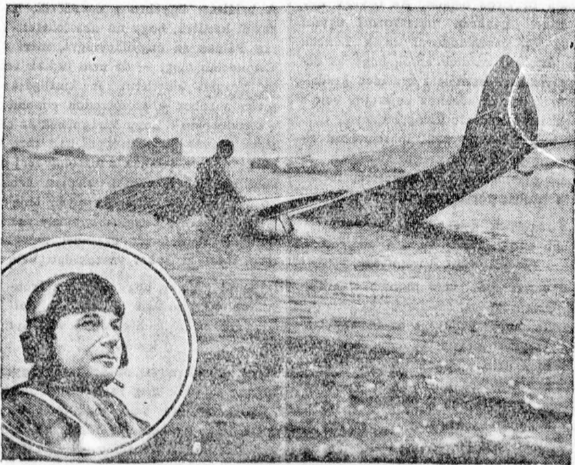
Udet, a német repülő, aki egy filmpedációval a sarkvidékre repült, repülőgépevel a grönlandi jégtengerbe süllyed — természetesen a filmszöveg előírásai szerint.

Az egyesület abban a meggyőződésben van, hogy ezen intézkedések után a közönség is bizonyára tartózkodni fog attól, hogy kizárólag vasutasokat illető fát, szenet vagy utalványt vásároljon, annál is inkább, mert az ilyen ügyek vizsgálatával járó jegyzőkönyvi kihallgatások és helyszíni szemlék révén a vevő is kellemetlenségnek, az utalványok elkoboztatása esetén pedig károsodásnak teszi ki magát.