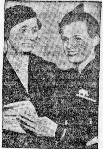
Eleonor Holm, egy 18 éves amerikai leány megnyerte az olimpiai hátúszás világbajnokságát. Egy hollywoodi filmgyár most 3 éves szerződést kötött a csinos uszónővel, aki havonta 4000 dollárt fog keresni.

és az a helyzet, hogy azáltal, hogy a rendelkezésre álló 250 ágy helyett a tífuszjárványra tekintettel 350 férőhelyet tudtak biztosítani és biztosítottak is, adósságokat csináltak s ez okból azoknak is