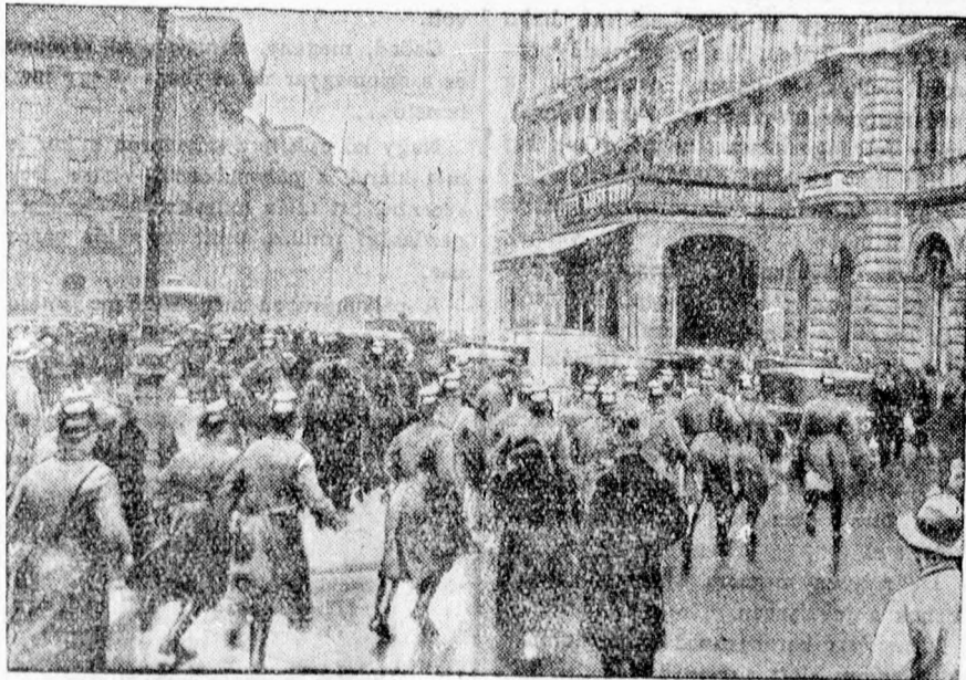
Rendőrség rohan a Kaisenhof-szálloda elé, hogy a nemzeti szocialista vezér híveinek tömege között utat teremtsen Hitler autója számára, amikor a birodalmi kancellári hivatalból visszatér.

sürgösen 200 q jó minőségű csöves tengeri 4 P, 3,5 q zab 8 P, 1000 q cckenderfi takarmányrépa 60 fillér, 50 q vegyes nagyságu burgonya 3 P 150 q réti széna 4 P. Árak q-ként értendők. — Egy jó állapotban levő 15 soros vetőgép 80 P, Egy igás szekér 40 P, eke, borona, henger, vízfordó-lajt és egyéb gazdasági felszerelések. — Értekezni lehet: Nagyerdei elágazás őrházánál.