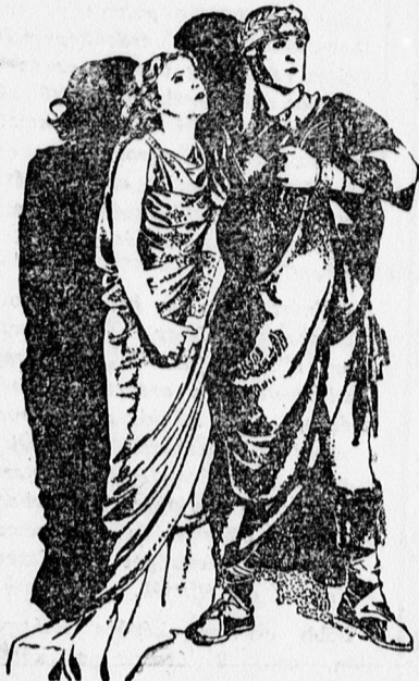
Elissa Landi és Fredric March.

A fenséges, magasztos, gyönyörködtető, izgalmas A főszereplők: