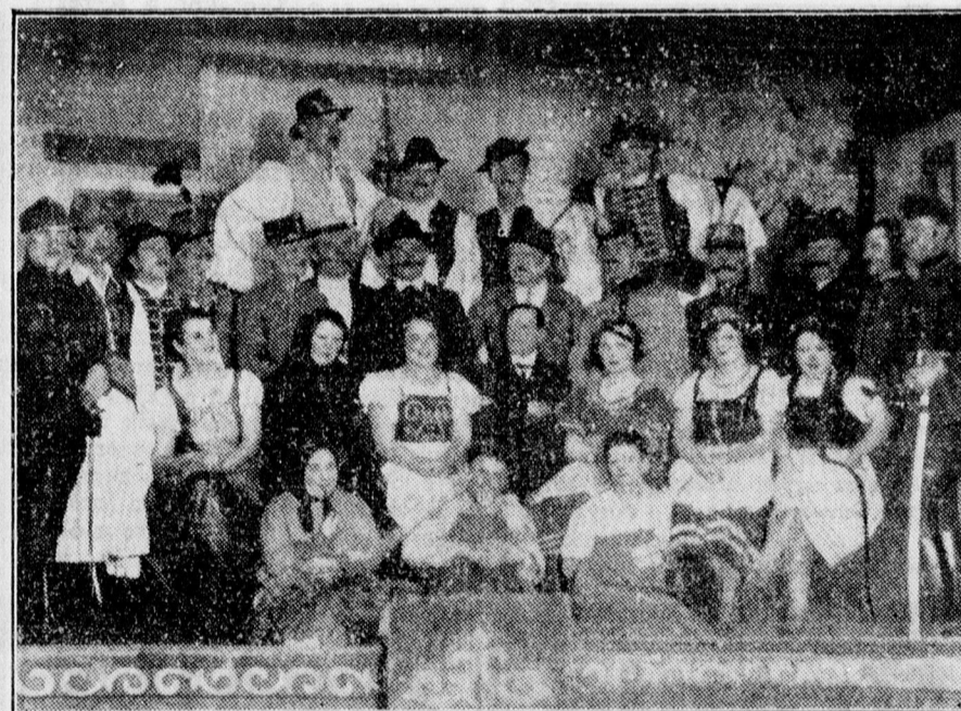
A Gábor Aron tűzészred debreceni részének altisztai önképzőkörre derék műkedvelői a Piros bugyeilárist adták elő zajos sikerrel.

Egy hét válassza el őket az előadástól, de szerepét mindenki tudja. És játszanak is. A szerelmes színészek, aki Gállyt alakítja, meglepetése lesz az előadásnak. De biztos nagy