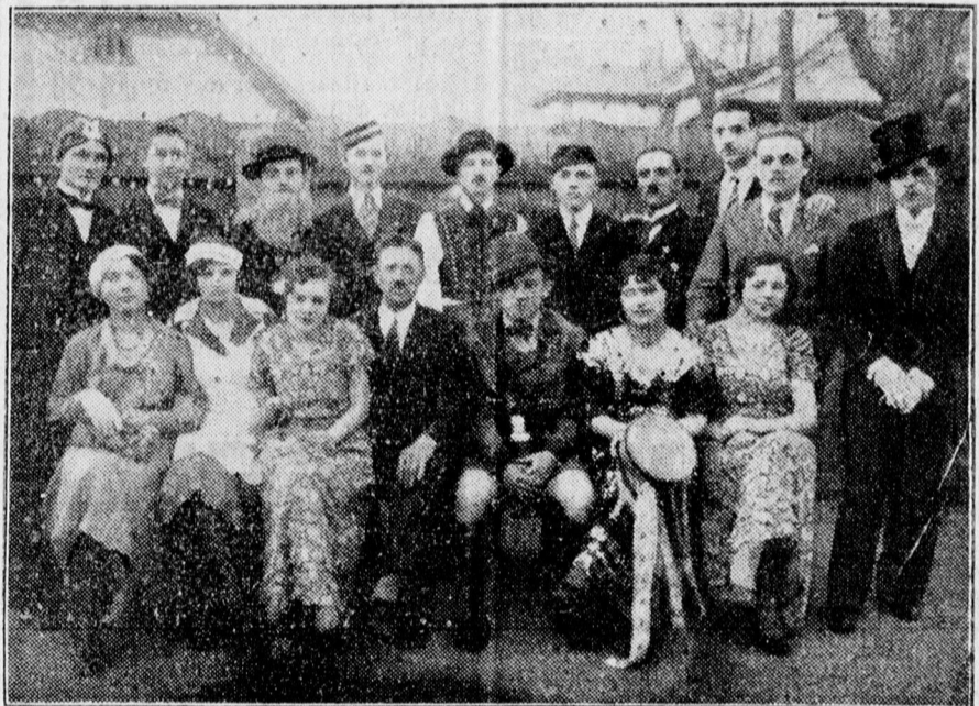
A Csapókerti Református Olvasókör tehetséges műkedvelői kabaré-műsorral szerepeltek a műkedvelő-versenyben.

kezdettel egy nagy sikerű operettet a Fehérvári huszárokat adják elő parádés szereposztásban, ragyogó kiállításban.