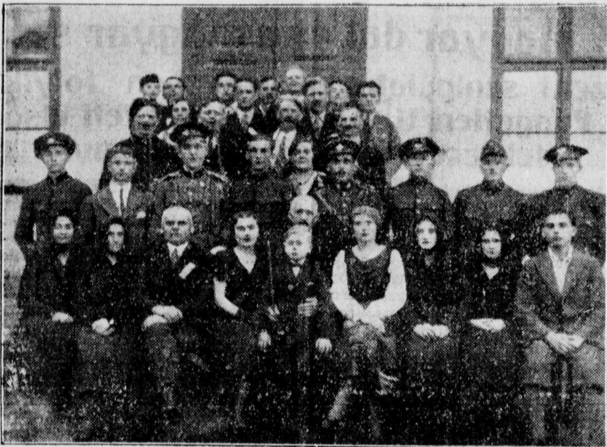
A Homokkerti Református Olvasó Egylet kitűnő gárdája a „Trianon” című darabot játszotta nagy sikerrel a Független Ujság műkedvelő-versenyének keretében.

Nagy ambícióval készülnek — lelkesednek, éppen úgy, mint a többiek, sőt talán még nagyobb az ambíciójuk, először rukkolnak ki háromfelvonásos darabban.