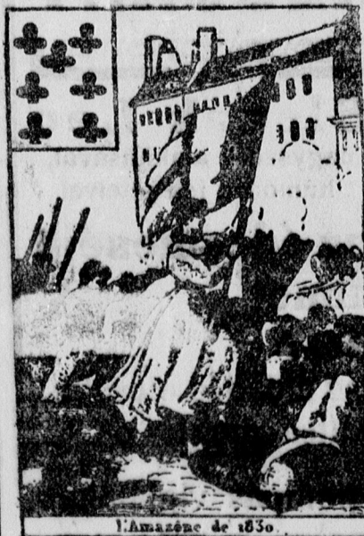
A francia forradalom egyik kártyafigurája.