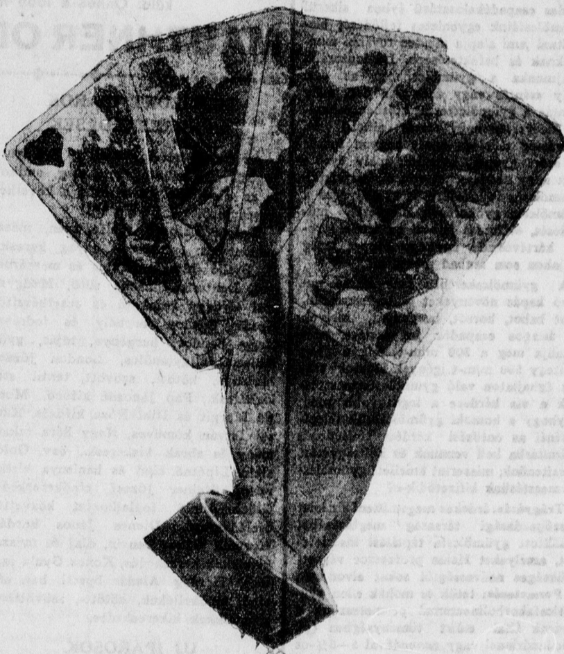
A világháború kártyái: IV. Károly, H. Vilmos, a Görök szultán és Ferdinánd bolgár cár a kártyalapokon.