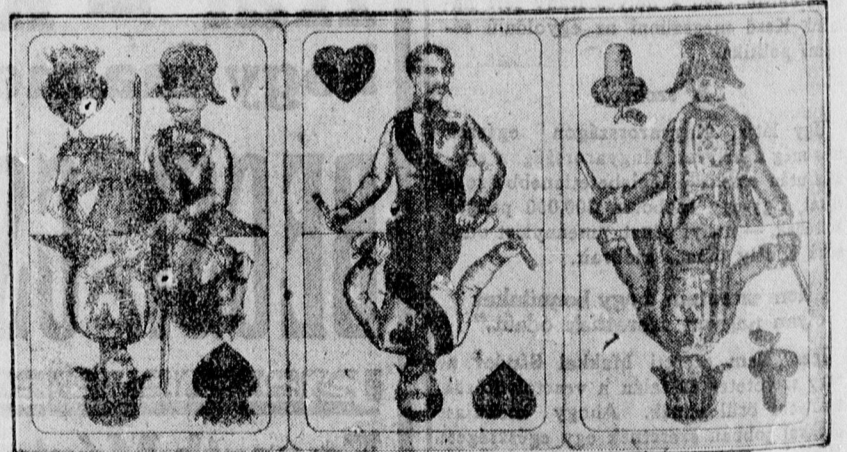
A Bach-korszak kártyalapjai: a vörös király: Windischgraetz herceg, a vörös felső Haynau, a makk felső: Jellasich, Zolnai Vilmos kártyagyűjteményéből.

A bolsevista Oroszországban először sítították a kártyát, amikor azonban látták, hogy a tilalom ellenére is játszik új kártyafigurákat kell kreálni, „Istentelen kártyáknak” nevezik ma is az orosz mindenki, még Lenin rendelte el, hogy