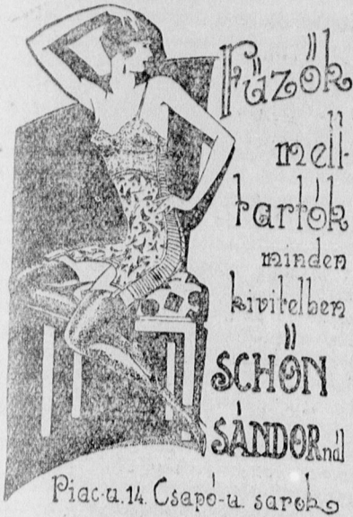
Piac-u.14 Csapo-u sarok

között, hogy egy ia képeit az Ady- állításán. Akkor ja és azóta sem jzot is egyik ba-