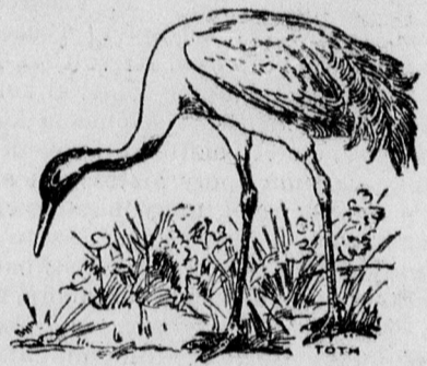
Madarak és emlősök kitömés

a bűnvádi eljárást hivatalból szorgalmazza.