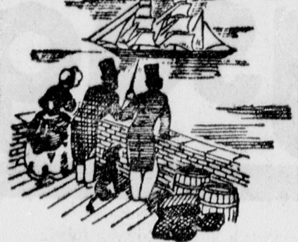
Közép-Amerika transzatlanti származó vélogutott kávéja