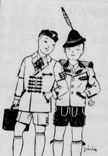
Vigan járnak iskolába Grünfeldtől kapott ruhába. Jó anyagja, szép szabása, Alig pár pengő az ára!

A LEGJOBB HIRDETÉSI ORGANUM A »DEBRECENI FUGGETLEN UJSAG«